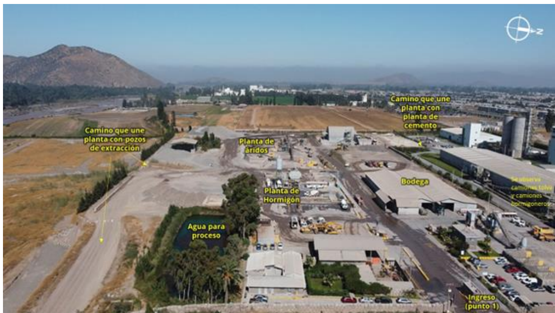
Figura N° 3: Vista de la planta de áridos, se observa en el interior del establecimiento una planta de hormigón.