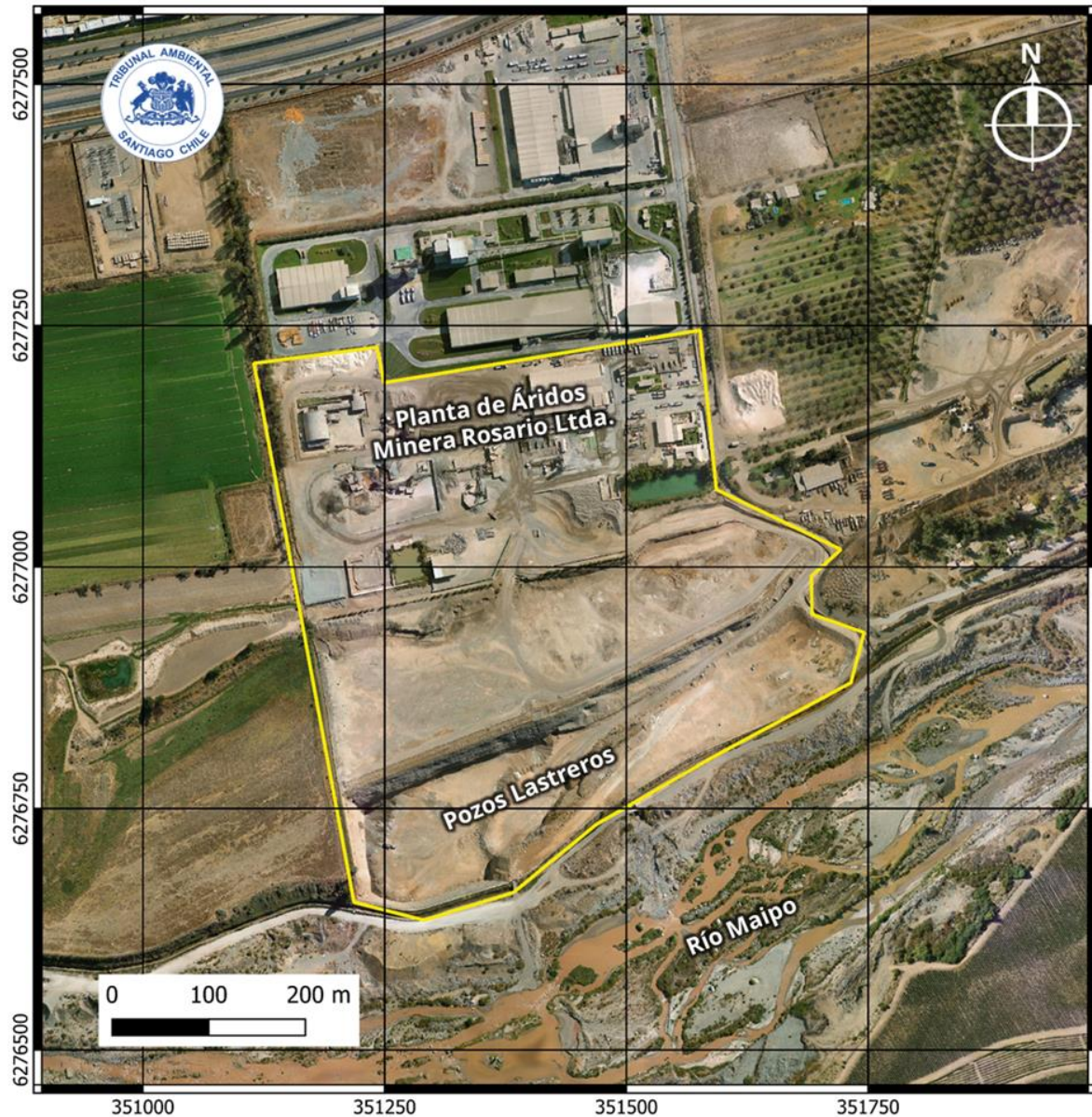
Figura N° 1: Ubicación de la Planta de Áridos Minera Rosario.

Fuente: Elaboración propia del Tribunal generada en QGIS 3.16 con antecedentes disponibles en el expediente de la causa, más Google Earth. Sistema de Referencia de Coordenadas WGS84 UTM Zona 19 Sur (EPSG:32719).