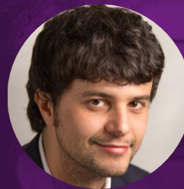
On. Brando Benifei Co-Rapporteur, AI Act