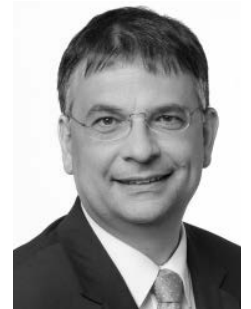
Dr. Christian Schefold

Mit dieser Veröffentlichung des Bundesministeriums der Justiz und für Verbraucherschutz (BMJV) erhält die Debatte um ein Unternehmensstrafrecht eine neue Dimension, da Artikel 1 dieses Gesetzesentwurfs zur Bekämpfung der Unternehmenskriminalität den Entwurf eines Gesetzes zur Sanktionierung von verbandsbezogenen Straftaten, kurz Verbandssanktionengesetz oder VerSanG (als Entwurf im Folgenden E-VerSanG), enthält. In diesem Beitrag erfolgt eine erste Darstellung des E-VerSanG und eine Kommentierung ausgewählter Auffälligkeiten. Es ist damit zu rechnen, dass die nächsten Monate von einiger Diskussion sowie auch Veranstaltungen zum Verbandstrafrecht geprägt und sicherlich eine ganze Reihe weiterer Aspekte entdeckt und entwickelt werden. Auf eine Anpassung des Entwurfs ist zu hoffen. Doch Unternehmen sollten sich jetzt schon auf die Einführung vorbereiten. Unabhängig von der Endfassung des Gesetzes ist ein Rahmen nun vorgegeben, und allein daher zeichnen sich bereits heute einige Änderungen für die Unternehmensorganisation und insbesondere den Aufbau von Compliance, Revision und Recht ab.